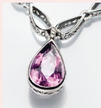
Balance durch Adaption: Die sich im Weißgold-Collier stetig wiederholende, zart durchbrochene Tropfenform erfährt im Turmalin-Anhänger ihren mutigen Mittel- und Höhepunkt.