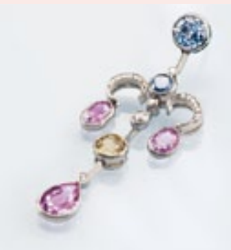
Balance durch Mixtur: Ein klassisches Zitat der Formensprache mit antiker Anleihe, barocken Einflüssen und moderner Kombination von Saphiren in Pastellfarben ist dieser filigrane Ohrschmuck.